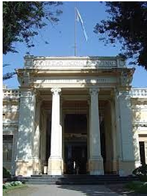
Figura 3: Fachada de la sede central de la Universidad Nacional de Tucumán.

una responsabilidad no solo de la comunidad universitaria sino de la sociedad en su conjunto. El futuro de la democracia argentina y su capacidad de desarrollo dependen, en medida significativa, de nuestra capacidad colectiva para defender el patrimonio universitario heredado y adaptarlo creativamente a los desafíos del siglo XXI. La pregunta que emerge de este análisis no es si las universidades argentinas enfrentarán amenazas a su autonomía —la historia demuestra que estas amenazas son inevitables— sino si seremos capaces de desarrollar los mecanismos institucionales, culturales y sociales necesarios para resistirlas exitosamente. La respuesta a esta pregunta determinará no solo el futuro del sistema universitario argentino, sino el destino de la República Argentina como sociedad democrática y próspera.